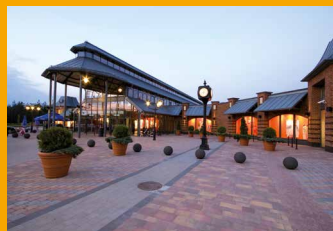
FASHION HOUSE Аутлет Центр Сосновец www.FashionHouse.pl