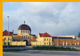
FASHION HOUSE Аутлет Центр Варшава www.FashionHouse.pl