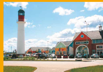
FASHION HOUSE Аутлет Центр Гданьск www.FashionHouse.pl