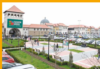
FASHION HOUSE Аутлет Центр Бухарест www.FashionHouse.ro